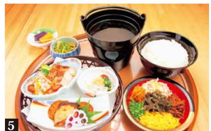
1 薩摩彩郷御膳 2,300円 2 松風御膳 2,160円 3 松風御膳 1,620円 4 鶏飯御膳 2,160円 5 鶏飯御膳 1,620円